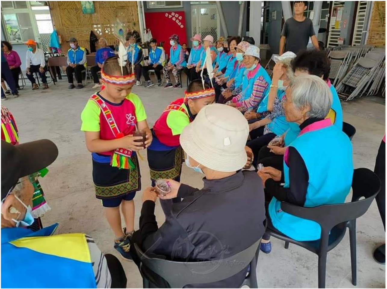
學生穿上傳統服飾向長輩奉茶，青銀共學，傳承文化。