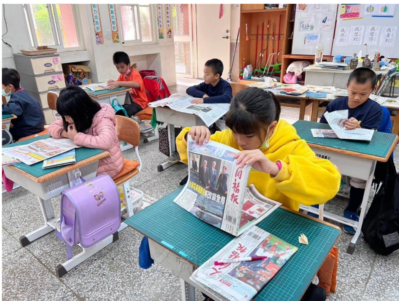
泰源國小進行《人間福報》閱讀教育，拓展學生國際視野。

學校跨領域主題課程「戀上泰源我的家」，以探索文化和生活體驗為核心，運用自然資源優勢及「教育累積」觀念，引領師生一起走讀、認識、關愛東台灣這塊福田，學生不僅從小就學習採訪及研究技巧，也在生活中實踐品格教育。