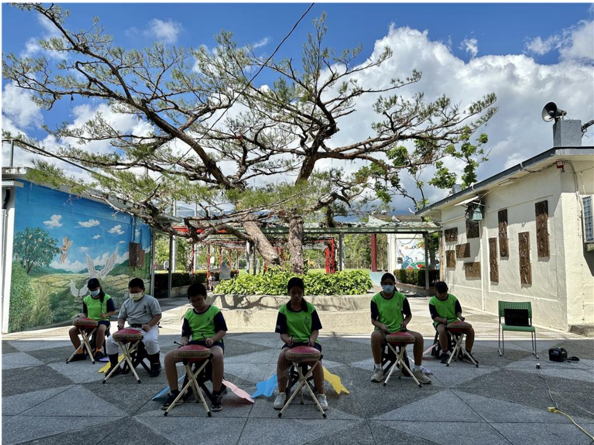
學校「空靈鼓隊」悠揚的樂聲，頗能沉澱心靈。