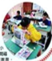
▶泰源國小進行《人間福報》讀報教育，拓展學生國際視野。

學校跨領域主題課程「戀上泰源我的家」，以探索文化和生活體驗為核心，運用自然資源優勢及「教育累積」觀念，引領師生一起走讀、認識、感受東台灣這塊福田，學生不僅從小就學習探訪及研究技巧，也在生活中實踐品格教育。