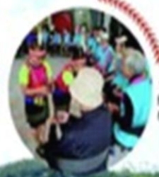
◀學生穿上傳統服飾，共慶祭典，傳承文化。