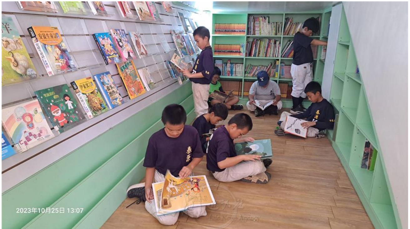
學校「閱讀秘密基地」，提供孩子自主的閱讀空間。