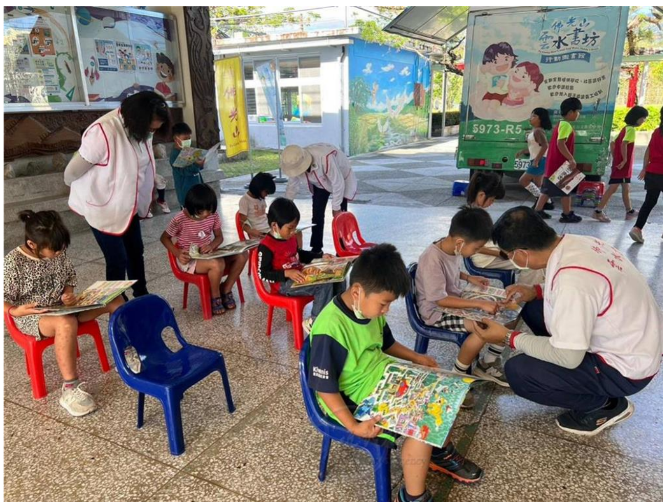
「雲水書車」開進校園，學童們在穿堂享受閱讀時光

台東縣東河鄉泰源國小因交通不便，每週僅能收到一次報紙，但師生們仍把握機緣，透過《人間福報》讀報教育吸收新知、培育三好品格；「雲水書車」也如飛