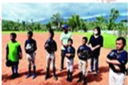
▲泰源國小棒球隊培養學生品格與紀律。